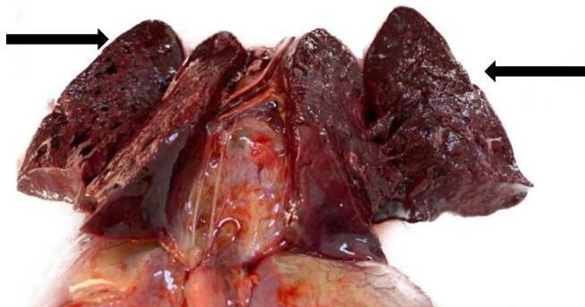
легкие новорожденного ребенка, мама которого переболела COVID-19 во время беременности (по плотности легкие такие же, как ткань печени)

Женщинам, в том числе, планирующим беременность и беременным, важно знать, что заболевание, вызванное коронавирусом COVID-19, во время беременности сопряжено с более высоким риском тяжелого течения инфекции у самой женщины и развития серьезных осложнений, угрожающих жизни и здоровью ее ребенка. У будущих мам намного выше риск преждевременных родов и появления на свет недоношенных детей. Кроме того, новорожденные дети у мам, перенесших инфекцию, чаще других нуждаются в проведении интенсивной терапии в условиях отделения реанимации. Приходится говорить и о более высоком показателе перинатальной смертности (гибель малышей внутриутробно или в первые 7 дней после рождения) и материнской смертности женщин, заболевших коронавирусной инфекцией во время беременности. Инфекция COVID-19 у матери может привести к внутриутробному поражению легких плода.